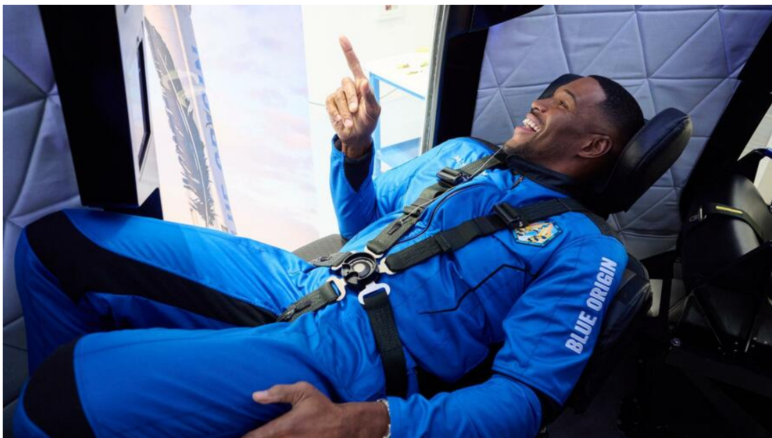
TV-Moderator Michael Strahan vor Ausflug ins All

Elon Musk, Jeff Bezos und Richard Branson erschließen den Weltraum. Für den Körper ist die Schwerelosigkeit eine Herausforderung – mit einem Vorteil.